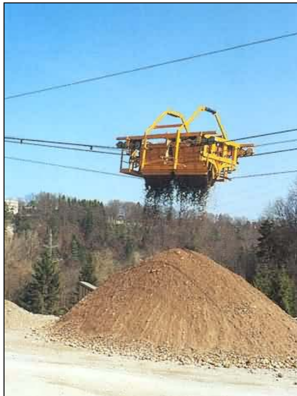
Teleféricos para Transportación de Material